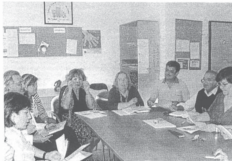
Encuentro de la comisión de participación ciudadana del centro de salud de San Benito.

Precisamente durante la reunión con los profesionales del centro se conoció que las instalaciones de San Benito no han podido obtener el certificado de calidad, según explicó Palomo, por dos cuestiones: una referida a la calidad de la atención y otra de carácter estructural, ya que el centro necesita habilitar dos nuevas consultas para dar cabida a todos los profesionales.